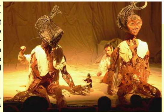
LES DERNIERS GEANTS